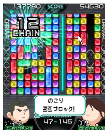
-avatar対応版 『キラクルオンライン』