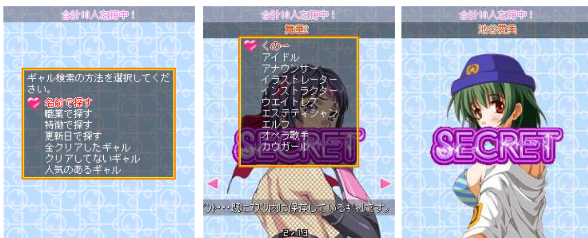
様々な検索ジャンルに対応！

『泡☆アワ美少女♪』では、アプリ内でギャルの検索、DLが行えます。全7パターンの検索方法で好きなギャルを自由に検索しよう♪もちろん、今まで通りサイトからのDLも行えます。