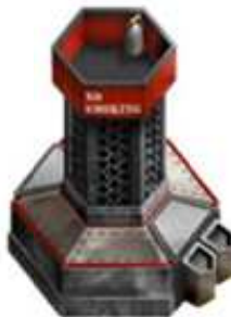
・フレイムタワー Lv.7