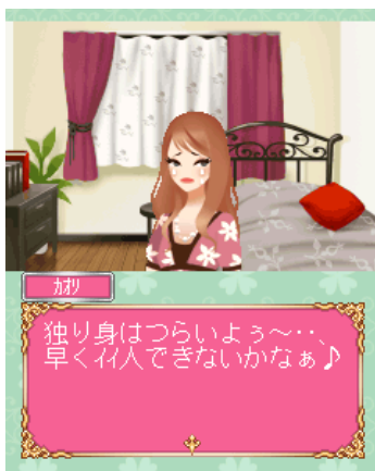
いい人できるかな？