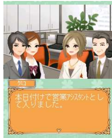
仕事先での出会い！