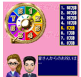
皆さんからのご祝儀もルーレットで