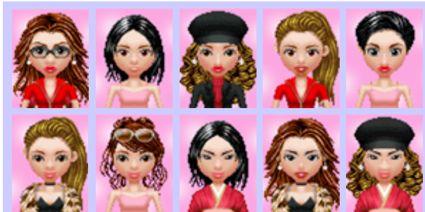
【キャラクター作成例】

各パーツをひとつ組み替えるだけで、ガラリとイメージが変わります。王道のセブ風格を狙うもよし、ちょっと突飛な組み合わせを狙うもよし、はたまた有名なアノ人に似せてみるのもアリかも？