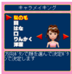
【キャラメイキング画面】

人生ゲームロイヤルセレブは、プレイヤーは全て女性に扮装します。恋多き女性となって、破天荒な愛の人生のイベントを繰り広げるのがゲームの目的です。アバターキャラクターは全て女性。女性主人公ならではのセブライフを満喫できます。今こそ時代の華となれ！最高のセブ目指して大変身！！