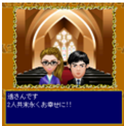
通さんです 2人共来永くお幸せに!!