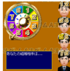
結婚相手もルーレットで決定!!