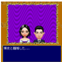
負け犬カードで離婚する場合も...

ゴージャスなセレブライフが幸せとは限らない!!誰もがうらやむセレブな人生にも大きな山あり谷あり、結婚の後には離婚もあり、そして電撃再婚もあります。カードを駆使して幸せを掴め!!