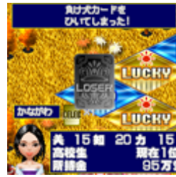
負け犬カードを引いてしまった。

幸運がより幸運を呼ぶ! 幸運マスでのイベント効果が増加。通常より多くのお金・能力アップが手に入ります。 不幸を避ける! 不運マスストップ時にカードを使えば、不運が転じて幸運イベントに! 電撃再婚! 離婚後、恋愛イベント時にカードを使えば、電撃再婚のチャンス! 負け犬返し! 押し付けられた負け犬カードを跳ね返すことが出来ます。 などなどセレブ度を高める効果バツゲン!