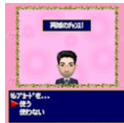
電撃再婚で世間を驚かせる?

ゴージャスなセレブライフが幸せとは限らない!!誰もがうらやむセレブな人生にも大きな山あり谷あり、結婚の後には離婚もあり、そして電撃再婚もあります。カードを駆使して幸せを掴め!!