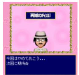
セレブカードで今度こそは玉の輿?