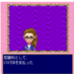
離婚で慰謝料を支払う羽目に